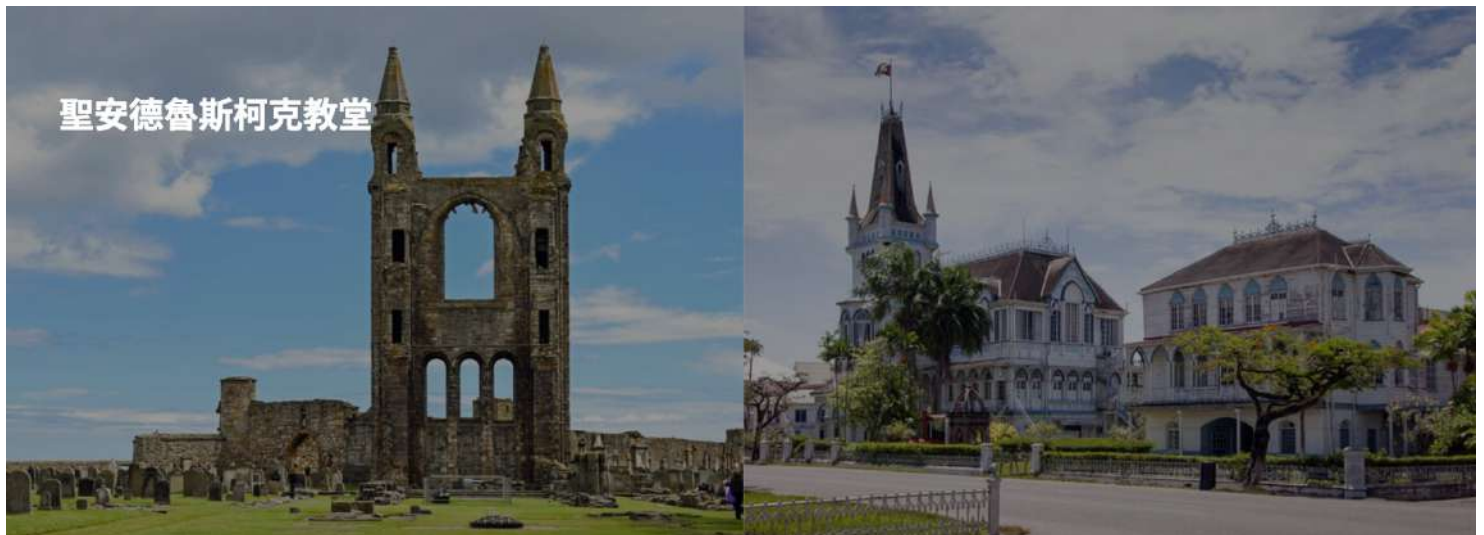
聖安德魯斯柯克教堂