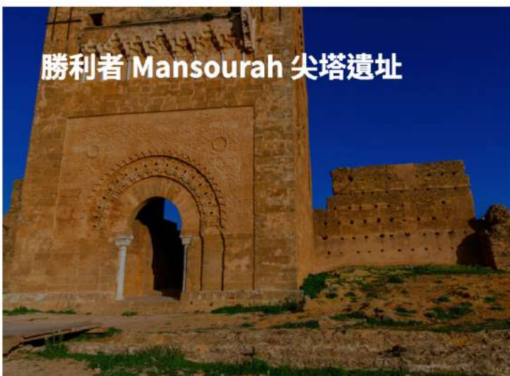
勝利者 Mansourah 尖塔遺址