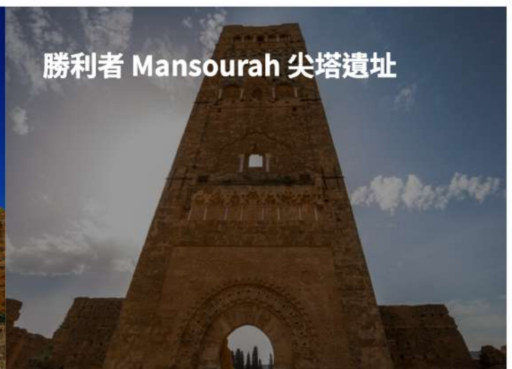
勝利者 Mansourah 尖塔遺址