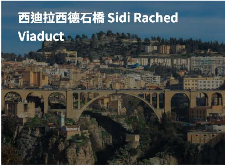
西迪拉西德石橋 Sidi Rached Viaduct