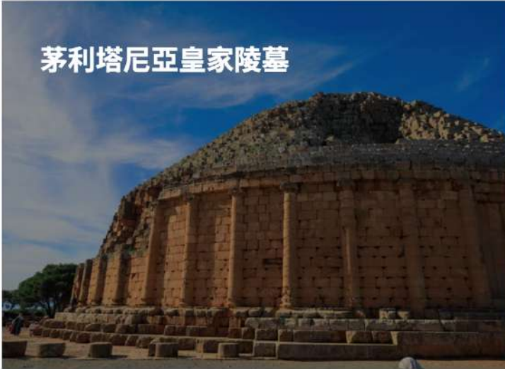
茅利塔尼亞皇家陵墓