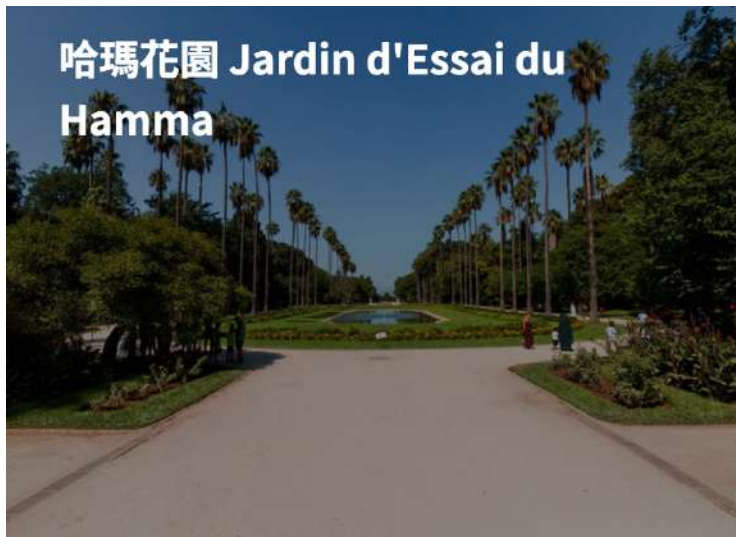
哈瑪花園 Jardin d'Essai du Hamma