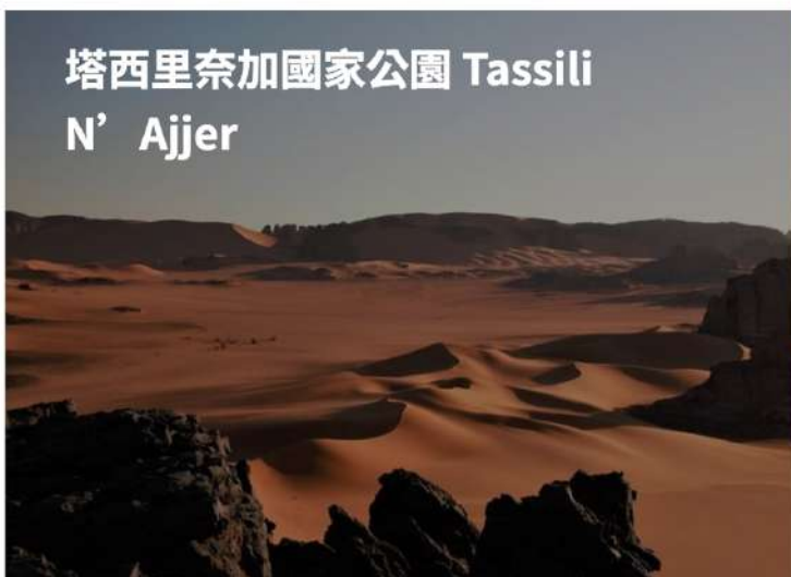
塔西里奈加國家公園 Tassili N'Ajjer

賈奈特 Djanet 🚗 塔西里奈加國家公園 Tassili N'Ajjer 🚗 博傑蒂傑 Bordj El Haouas