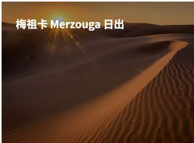
梅祖卡 Merzouga 日出