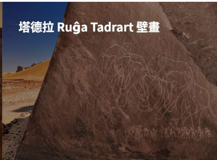
塔德拉 Ruğa Tadrart 壁畫

今晨在一望無際的撒哈拉沙漠上的沙丘上，欣賞日出。前往吐瓦雷格之窗，隨後所前往的地區非常多的隕石區域，您可以看到地表上多是黑色，您也非常容易在路上看到許多隕石。午後進入到塔德拉區，塔德拉地區有一半位於利比亞，另外一半位於阿爾及利亞，在塔德拉地區您又可以欣賞到圓頭時期的史前壁畫。橘色沙丘或 Red Tadrart 或 Tadrart Algeria 或紅色星球或火星是一個地理區域，位於大撒哈拉沙漠中阿爾及利亞東南部的伊利齊省賈內特市，其中散佈著山脈。哈拉沙漠中阿爾及利亞東南部的伊利齊省賈內特市，只有這兒才有這特殊景觀。