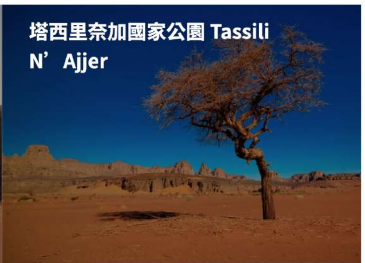
塔西里奈加國家公園 Tassili N'Ajjer