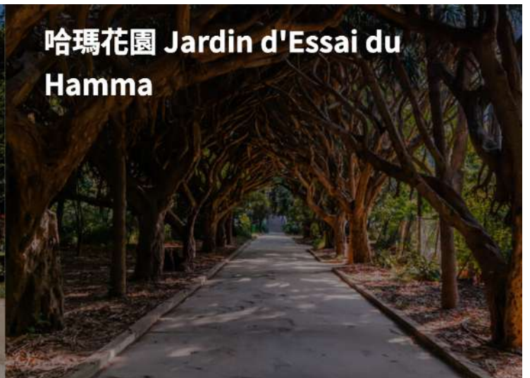
哈瑪花園 Jardin d'Essai du Hamma

午後搭機返回阿爾及爾，隨後前往擁有 32 公頃的▲哈瑪花園，目前花園裡估計有 1,200 種不同的植物。此處是阿爾及利亞青年男女的戀愛花園，可一窺法國殖民期間女性的社交花園。★巴杜博物館為史前博物館，詳細介紹阿爾及利亞的史前文化，關於舊石器時代與新石器時代的器物製作，該處也是安達魯西亞式建築的代表，可看到傳統老宅的樣式。▲阿爾及爾聖母院，非洲最大教堂建築。晚上搭機飛往南方的德珍奈特。撒哈拉沙漠是世界最熱的荒漠，亦是世界第三大荒漠，僅次於南極和北極，同時也是世界上最大的沙漠，其總面積超過九百四十萬平方公里，與美國國土面積相當。撒哈拉沙漠東至紅海，西至大西洋，南部則為薩赫爾和非洲中部和西部的北端地區。撒哈拉沙漠中的一些沙丘高度可達 180 公尺。賈奈特是一處綠洲，空氣稍涼、濕度較高且降雨量較多，與撒哈拉低窪地區相比，附近的山脈擁有更多數量和種類的野生動物，並構成撒哈拉山地乾旱林地生態系統的一部分。