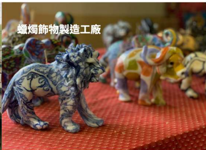
蠟燭飾物製造工廠

今日上午行經首都蒙巴本近郊有「皇家谷地」之稱的●伊祖威尼谷地，此地乃現任國王所居住的地方，依山傍水、風景優美；隨後驅車前往參觀著名的▲玻璃工廠，不但可實際參觀到各種玻璃飾品的燒製過程，同時展示間內陳列了千百種造型奇特有趣手工玻璃製品供您選購珍藏。我們亦將會參觀▲蠟燭飾物製造工廠。遊人在此將詫異的發現看似平實無奇的蠟塊，但在技巧熟練的捏蠟人的手中，轉眼間一件件造型有趣而色彩豔麗的蠟製飾物便呈現在眼前。而著名的史瓦濟非洲傳統手工藝品市場，在長達 200 公尺，多達百家的傳統商舖，展示各式各樣風格純樸脫俗，做工精美而深具非洲特色風情的純手的藝品，更是您不可錯過的尋寶之地。午後驅車前往南非的新堡 (New Castle)。