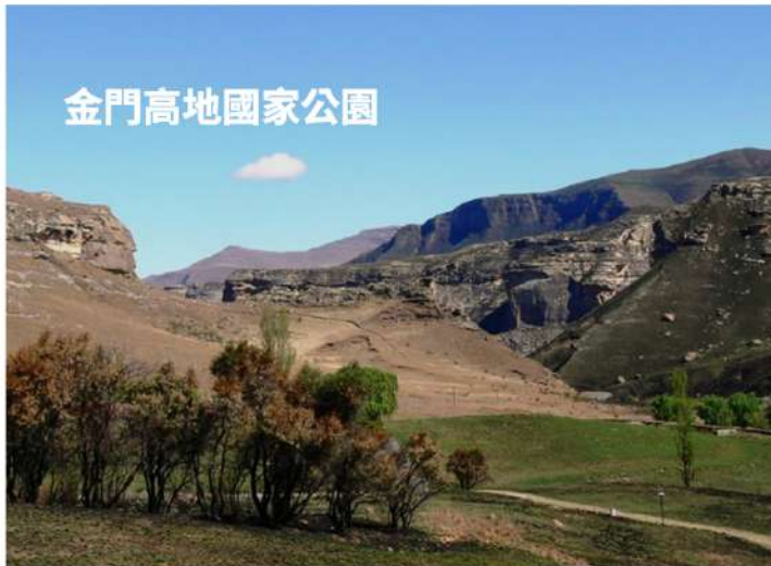
金門高地國家公園