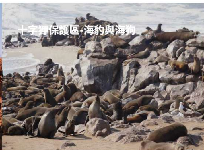
十字狎保護區-海豹與海狗