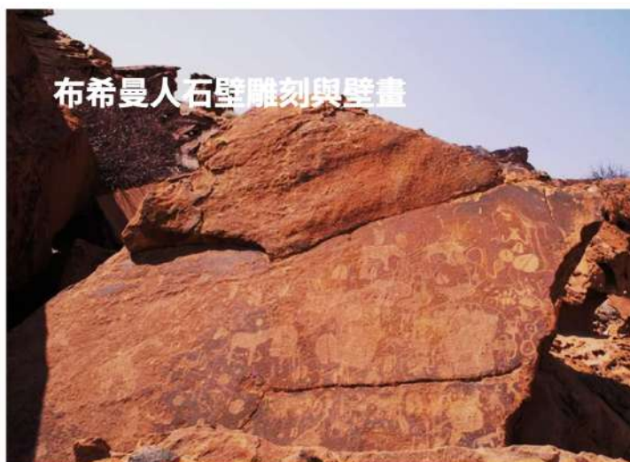
布希曼人石壁雕刻與壁畫

【宿】：Hansa Hotel 或 Swakopmund Hotel 或 Hotel Europahof 或 Hotel Zum Kaiser 或 Strand Hotel