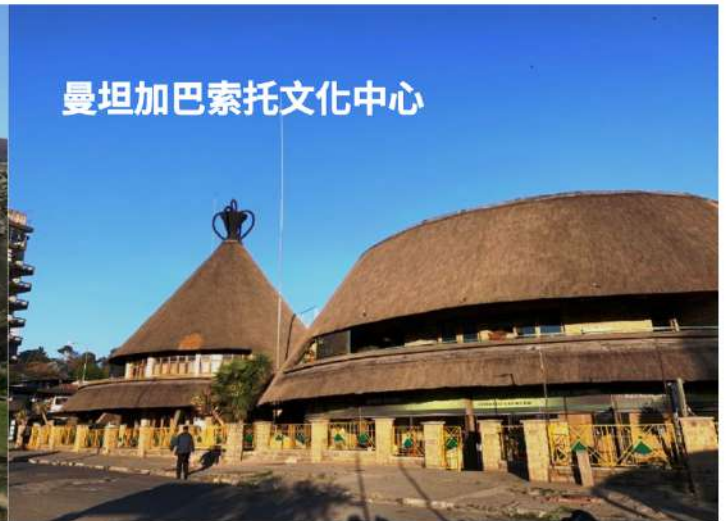
曼坦加巴索托文化中心