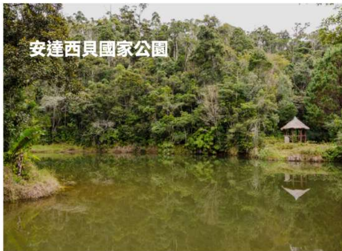
安達西貝國家公園