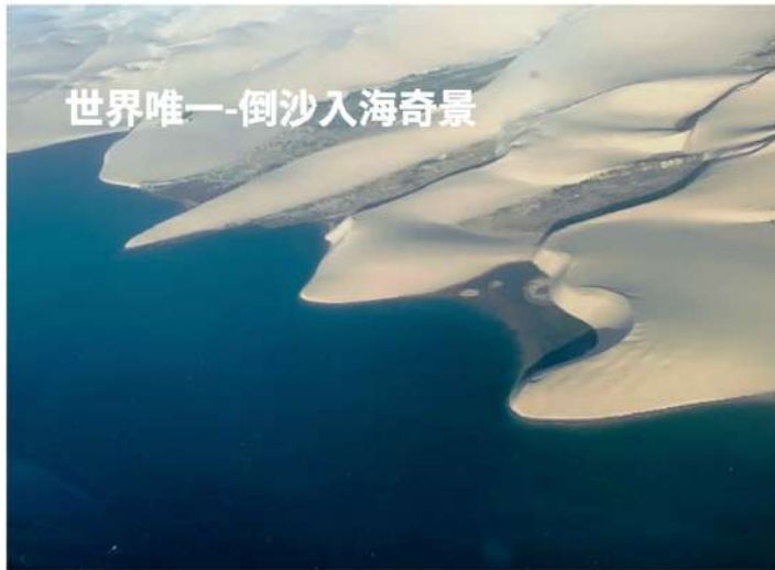
世界唯一-倒沙入海奇景