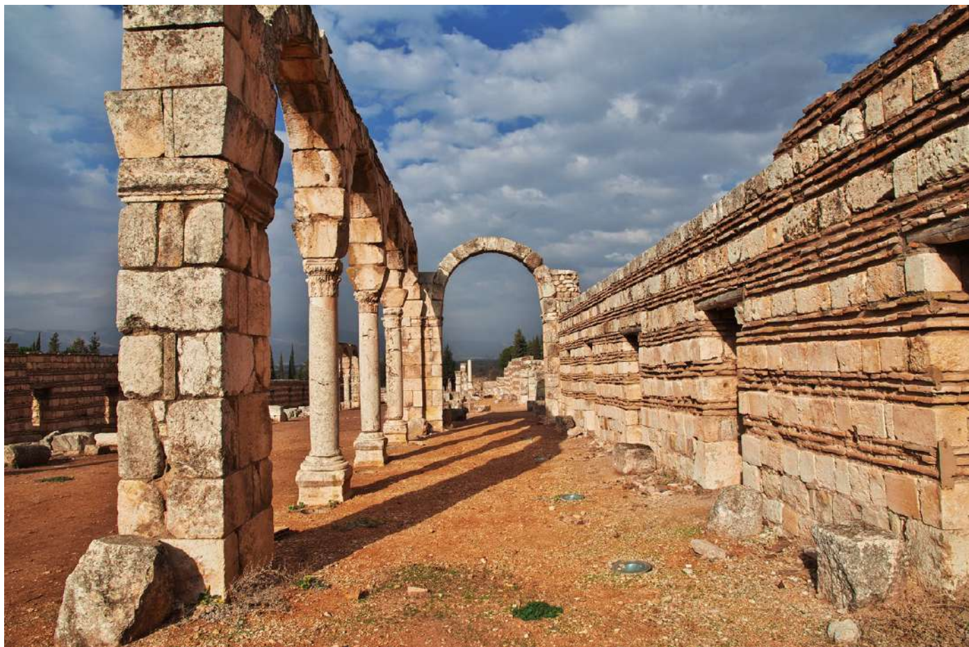
埃爾比勒城堡－一座被聯合國教科文組織列為世界遺產的城堡,也是最古老的持續有人居住的定居點之一。