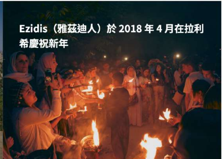
Ezidis (雅茲迪人) 於 2018 年 4 月在拉利希慶祝新年