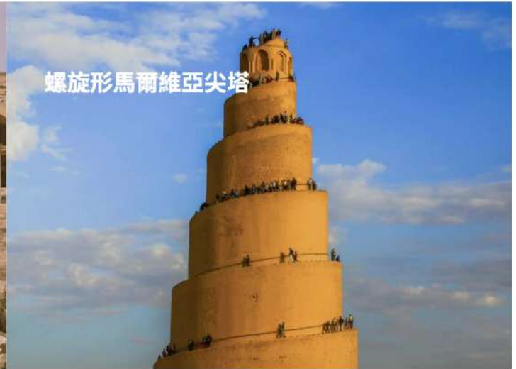
螺旋形馬爾維亞尖塔