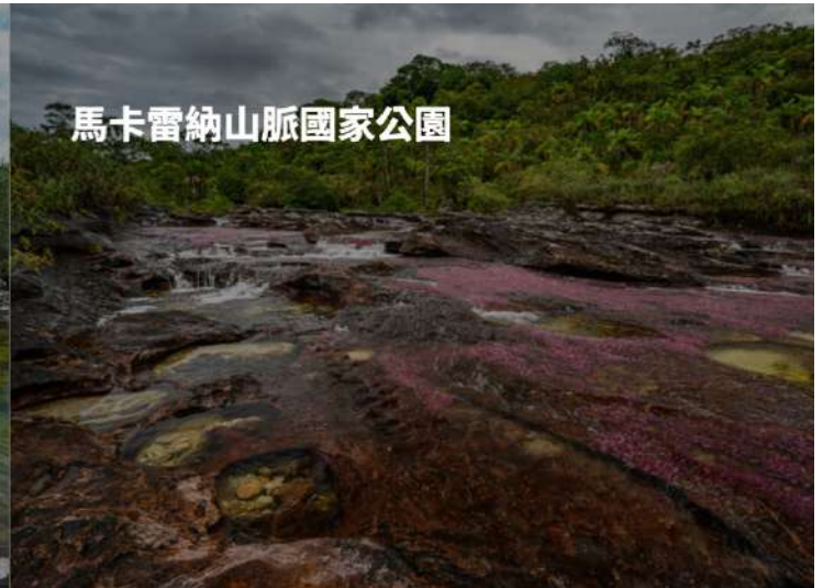
馬卡雷納山脈國家公園