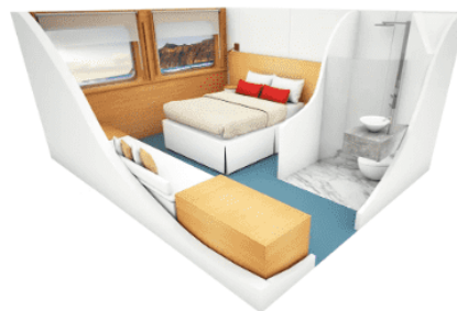
■ Junior Suite