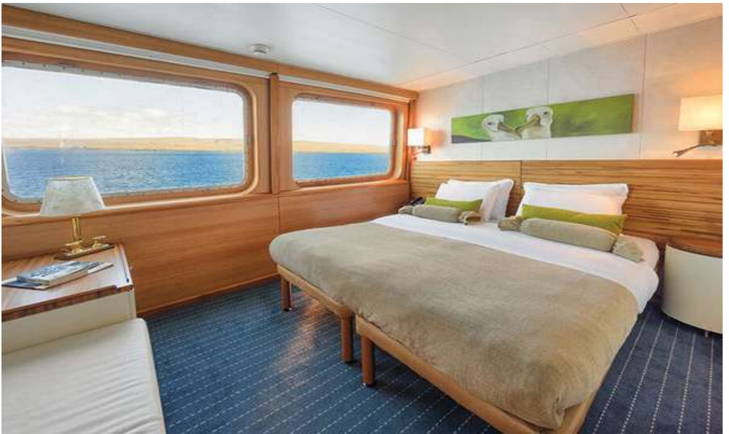
加拉巴哥傳奇號小套房