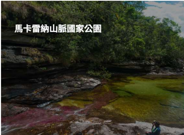
馬卡雷納山脈國家公園

【宿】：Hotel La Fuente 或 Real Casa Hotel 或同級