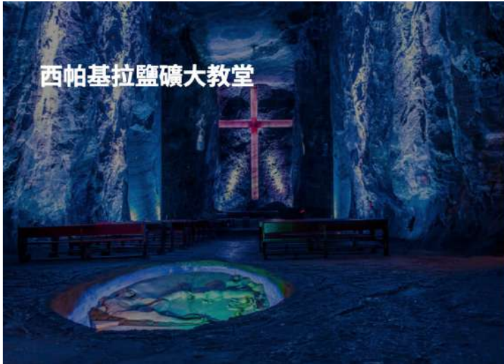
西帕基拉鹽礦大教堂

拉馬卡雷納 La Macarena ✈️ 波哥大 🚌 西帕基拉鹽礦大教堂 🚌 波哥大