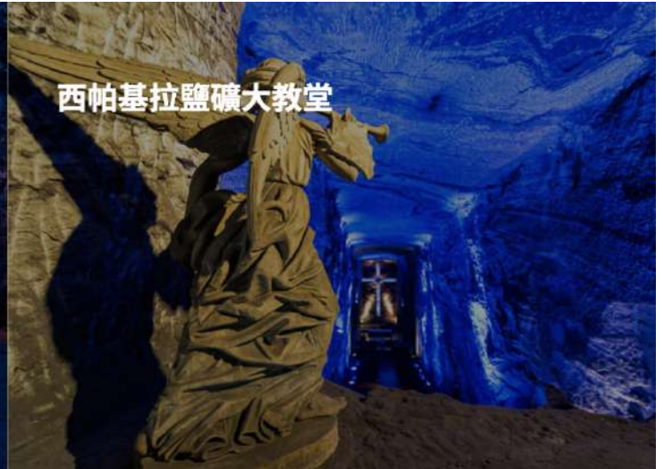
西帕基拉鹽礦大教堂

上午搭機返回波哥大後前往★西帕基拉鹽礦大教堂(ZIPAQUIRA SALT CATHEDRAL)。教堂深藏地下約 200 公尺深，規模卻極為驚人，足夠容納 8500 人，是世界上最大的地下教堂。每個星期日中午都有約 3000 名遊客參訪。這裡也舉辦過音樂會，由於鹽岩壁不會造成回音，所以音效很好。午後前往瓜達維塔酋長湖，此湖是黃金傳說的起始，是哥倫比亞原住民聖地。回程路上經過紀念品店可採買些手工藝品。