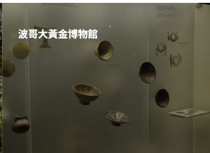
波哥大黃金博物館