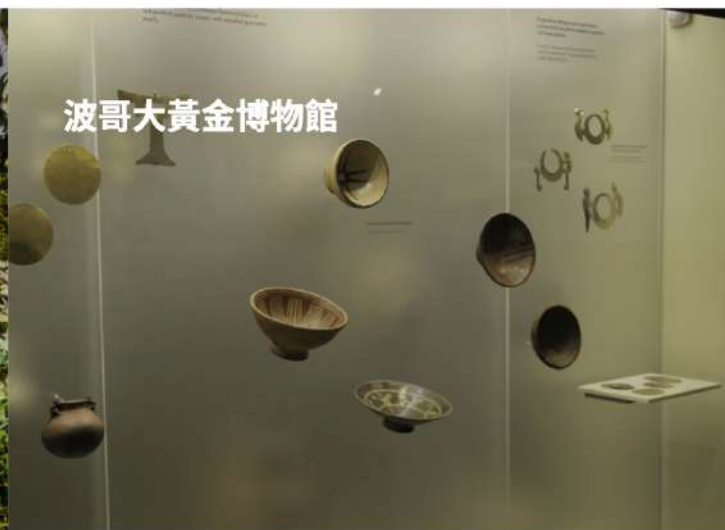
波哥大黃金博物館

波哥大市區觀光：★黃金博物館，聖坦德爾公園內有世界上規模最大的黃金博物館，也是國家的重要古蹟之一。館內的展品琳琅滿目、富麗堂皇，都是古代印第安人的裝飾品和舉行各種宗教儀式用的器皿，多達 2.4 萬件。富麗堂皇的▲聖卡爾洛斯宮，是一座已有 300 多年曆史的古老建築，曾先後作為聖菲皇家圖書館和獨立後的國家總統府。當年博利瓦爾曾在宮內居住過，院內有他親手栽種的胡桃樹，1828 年 9 月 25 日，他為躲避一次暗殺，曾從監街的窗戶一躍而下，逃到經阿古斯丁河石橋下隱藏了兩個小時才幸免於難，如今在這扇窗戶上，還懸掛着記載此事經過的木牌。▲聖克拉拉教堂、▲七月二十日博物館、★殖民藝術博物館等。