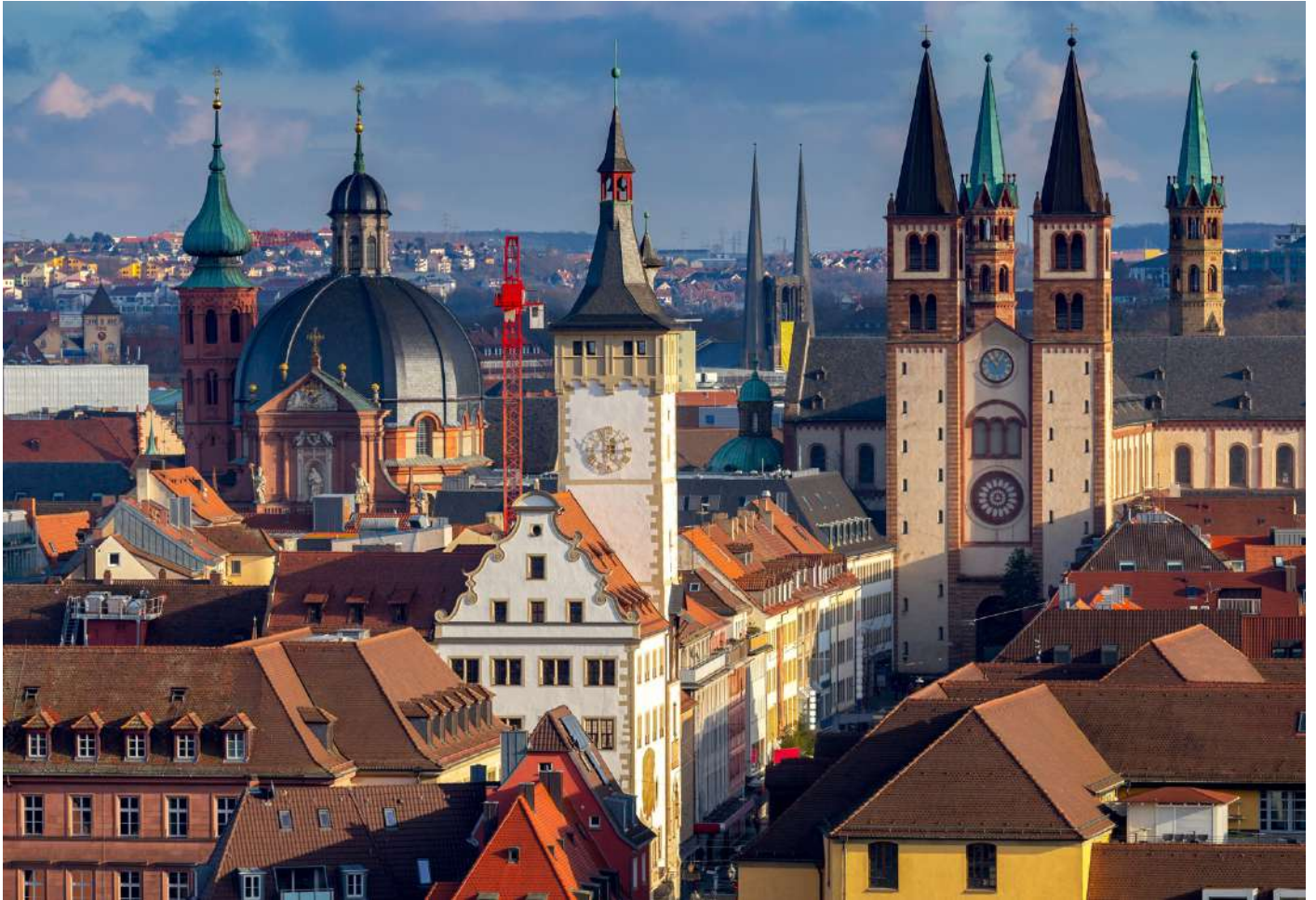
(2) 羅騰堡：有《中世紀的珠寶》之稱，完整城牆、城門，石頭街道上盡是一棟棟童話般的屋。