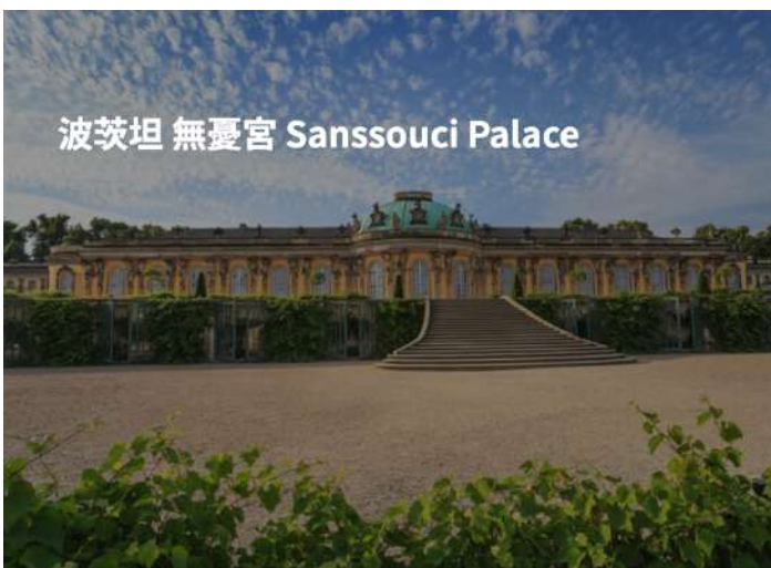
波茨坦 無憂宮 Sanssouci Palace

【宿】：Radisson Blu Hotel 或 Linder Congress Cottbus 或 Sorat Cottbus 或同級